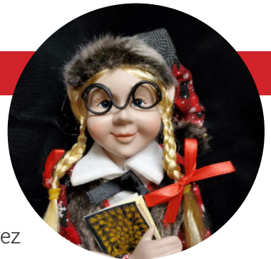
PHOTO AVEC LE PÈRE NOËL

Venez découvrir ses tours enchanteurs, récupérez les indices mystérieux, et courez la chance de gagner un prix fabuleux !